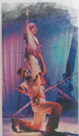
■ "Mente en Blanco" reflexiona sobre la ceguera y cómo la percibe la sociedad.

Los boletos tienen un costo de 50 pesos y el espectáculo dirigido a todo público iniciará a las 20:30 horas.