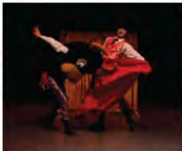
Olé, divertida obra presentada en el Centro de las Artes de Guanajuato.