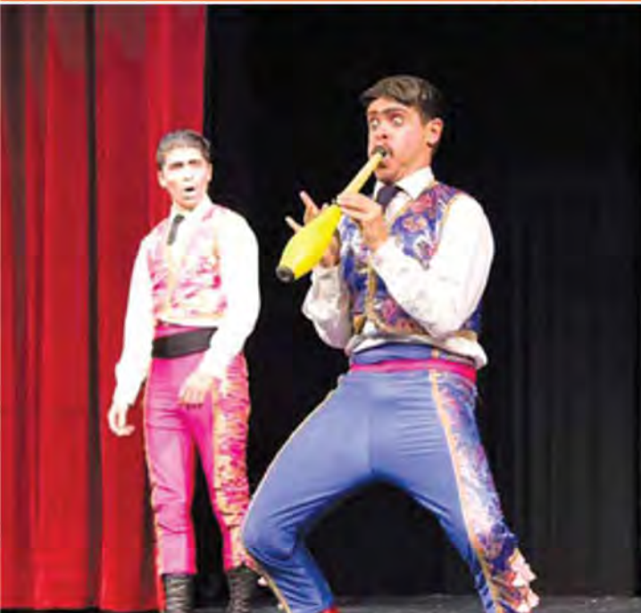
Los Hermanos Bravisimo de Guadalajara México participaron en el programa de variedades de Malabares Kansas City de este año en la Preparatoria Rockhurst. Vea Artículo en la página 4.